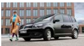
Touran / Sharan