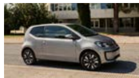
up! / e-up! / Fox