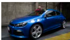
Scirocco / Eos