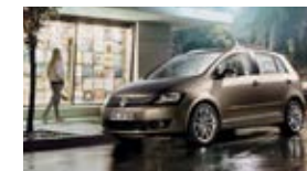
Golf VI / Jetta / Golf Plus depuis 2010