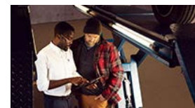
Les opérations complémentaires