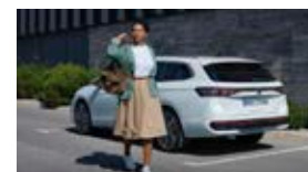
Passat / Passat CC / CC