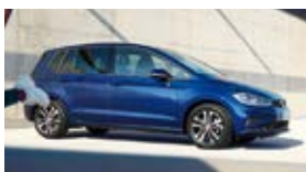
Golf VII / Golf Sportsvan / e-Golf