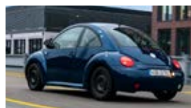
New Beetle / Coccinelle